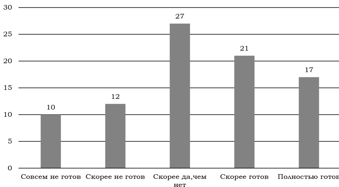
Рис. 3. Распределение ответов на вопрос «Оцените по 5-бальной шкале, насколько Вы готовы рассматривать госслужбу как место работы?» (в % от числа опрошенных)

Результаты исследования выявляют чёткую иерархию приоритетов при выборе места работы среди респондентов. Доминирующим фактором выступает материальная мотивация. Высокая заработная плата занимает лидирующую позицию (18%), что свидетельствует о первостепенной значимости финансово-