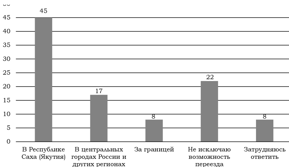
Рис. 6. Распределение ответов на вопрос «Где Вы планируете работать и строить свою карьеру?» (в % от числа опрошенных)

Результаты исследования демонстрируют преобладание локально ориентированных карьерных стратегий при наличии