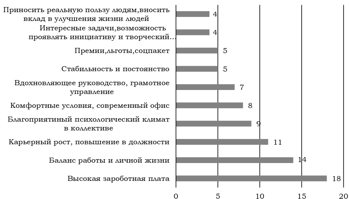
Рис. 4. Распределение ответов на вопрос «Какие критерии наиболее важны для Вас при выборе места работы?» (в вопросе можно было выбрать не более 5 вариантов ответа)

го обеспечения в трудовых предпочтениях.