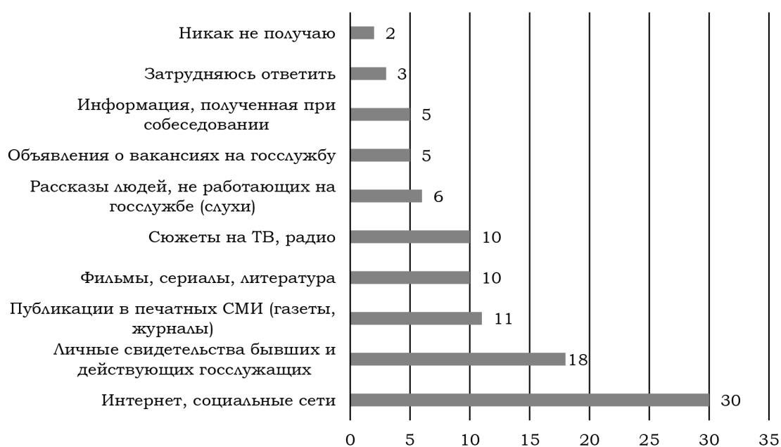
Рис. 5. Распределение ответов на вопрос «Какие каналы получения информации Вы предпочитаете?» (в вопросе можно было выбрать несколько вариантов ответа)